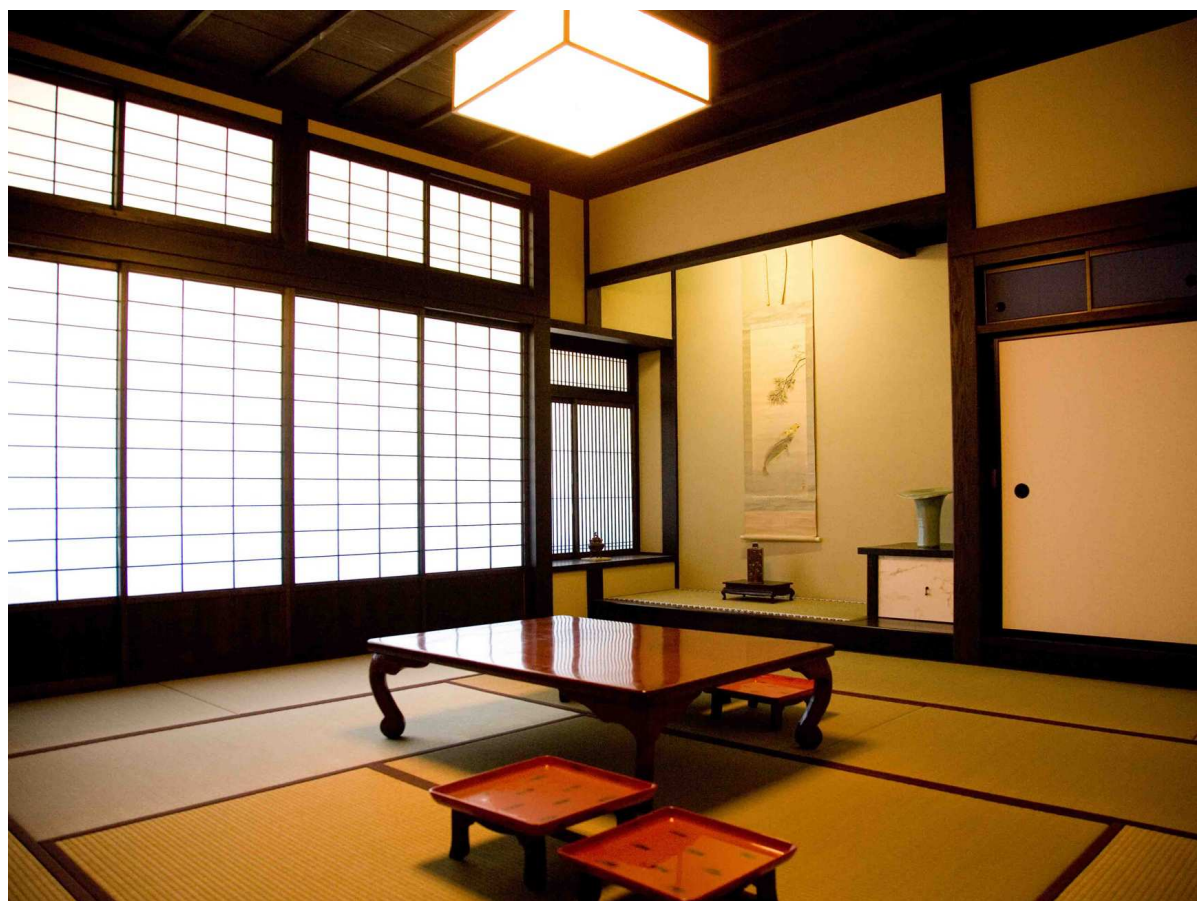
10. 再生後の和室客間