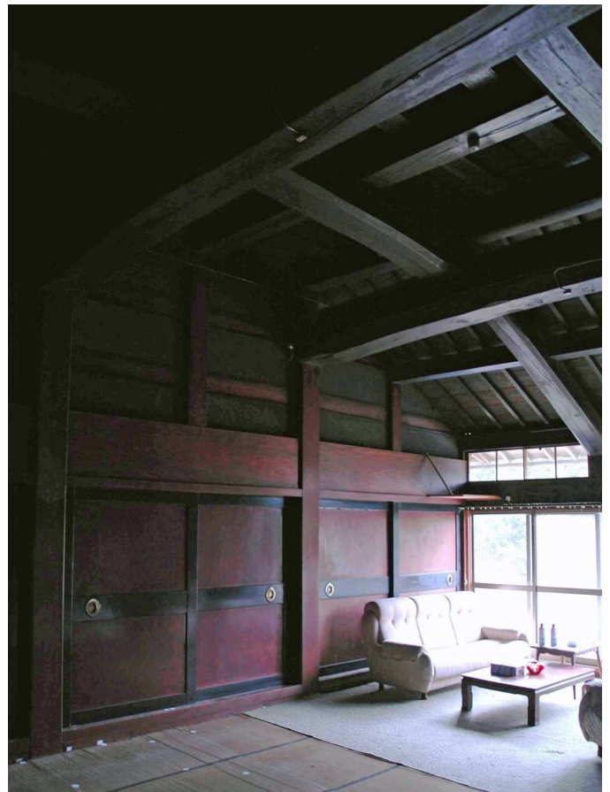
3. 移築再生前の広間