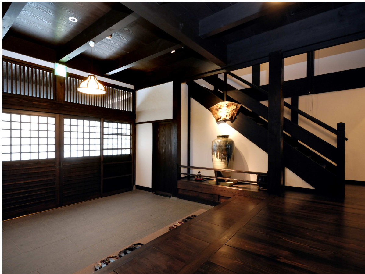
9. 再生後の玄関内観