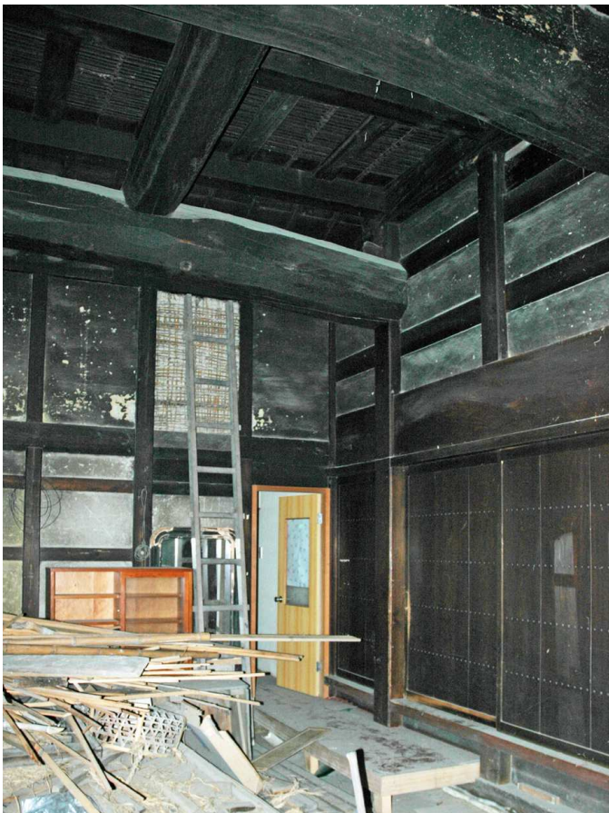
2. 移築再生前の土間内観