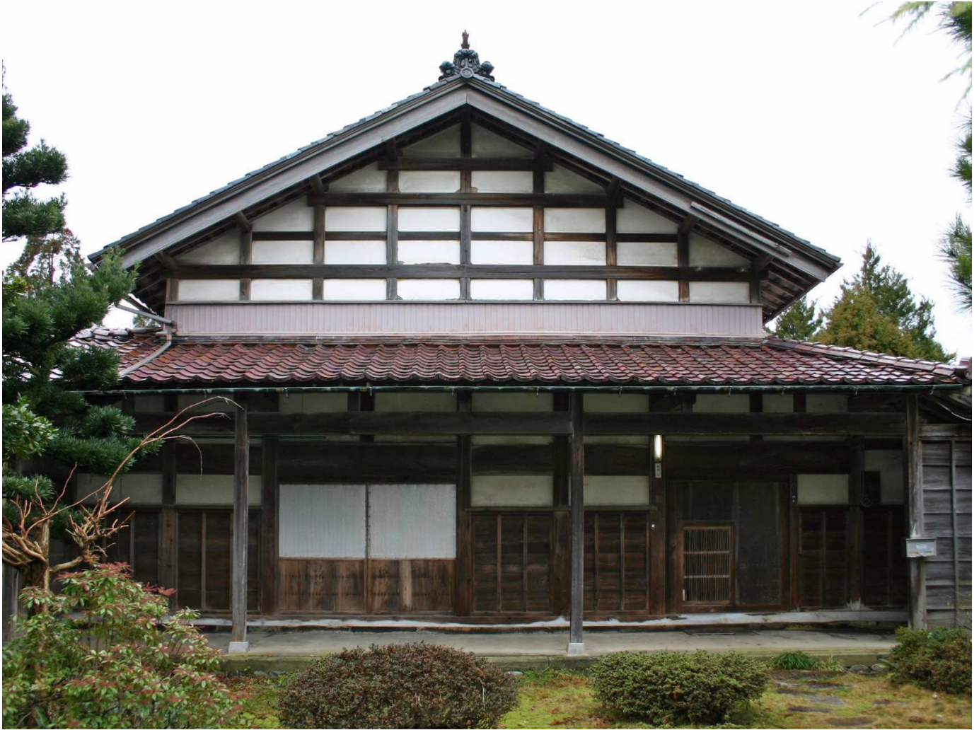
1. 移築再生前の玄関外観