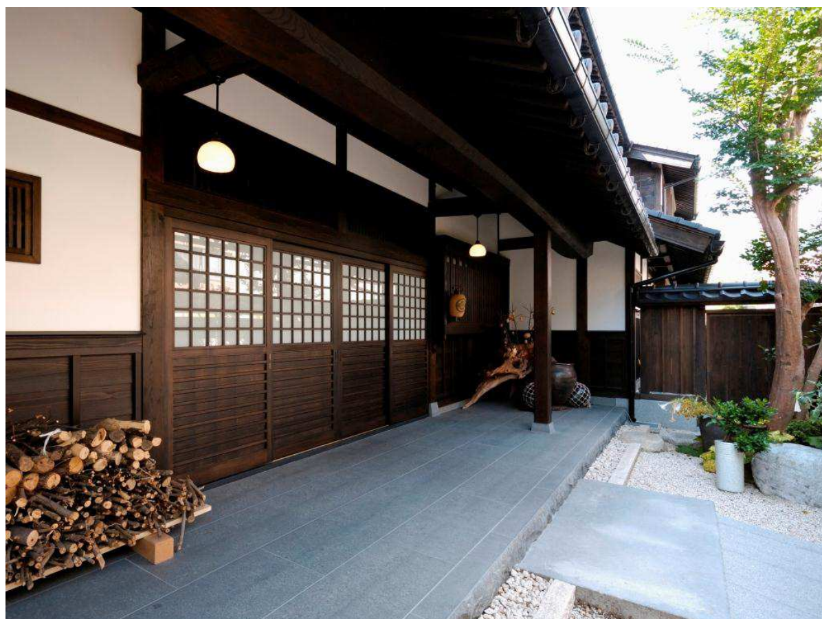
8. 再生後の玄関外観