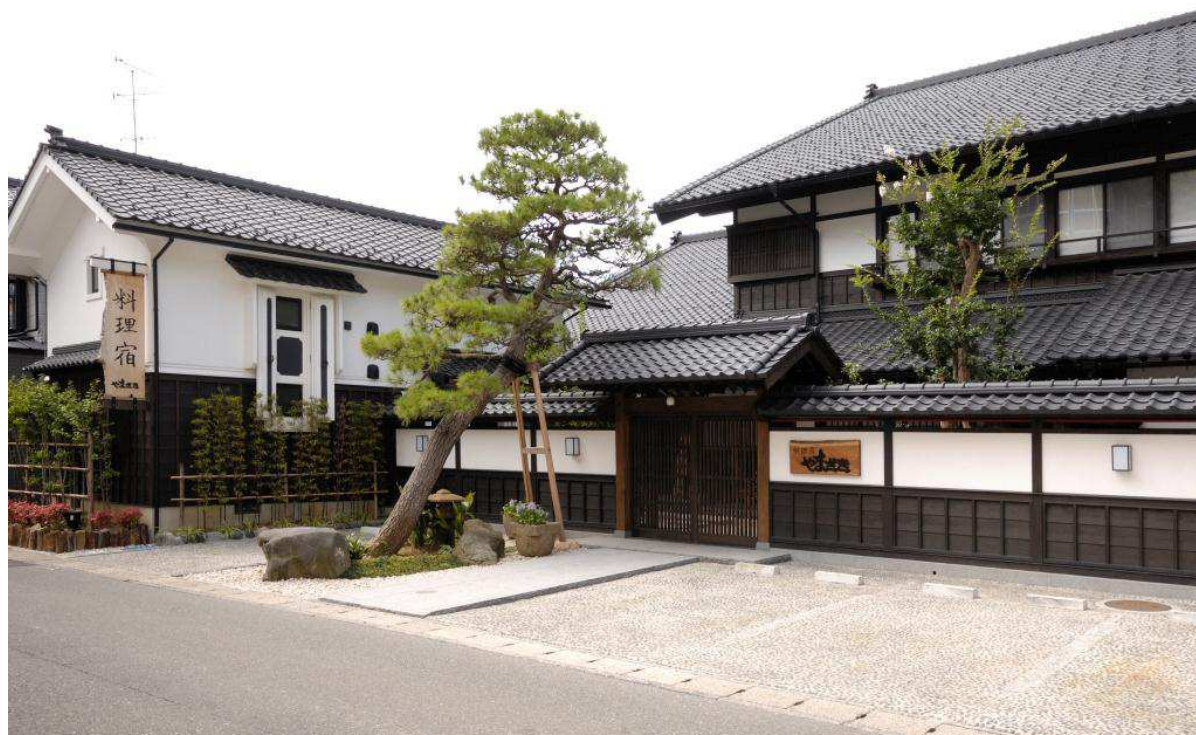
7. 移築再生後の外観